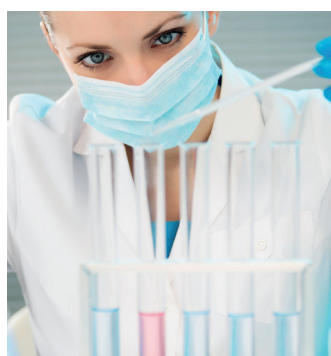
Chimie - Pharmacie