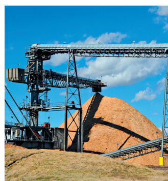
Mines - Carrières

Les indications portées sur cette documentation ne le sont qu'à titre indicatif et ne sauraient engager la responsabilité de LATTY international. En effet, nous ne garantissons pas les performances de nos produits en cas de montage défectueux ou en cas d'utilisation non conforme aux indications portées. LATTY international ne répond que de la qualité de ses produits, n'intervenant ni dans le montage, ni dans la mise en œuvre qui doivent être faits dans les règles de l'art.