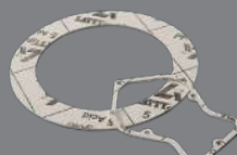
LATTYgold 5 ACID