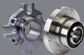
Cierres mecánicos dobles

Cierres mecánicos robustos adaptados a ambientes abrasivos, para fluidos cargados y/o condiciones de aplicación difíciles