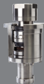
Boîtiers d'agitation haut et fond de cuve

LATTY INTERNATIONAL S.A. 57 bis, rue de Versailles 91400 ORSAY - FRANCE Tel. +33 (0)1 69 86 11 12 sales-marketing@latty.com