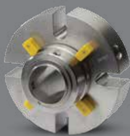
Garnitures Mécaniques doubles LATTY

Les systèmes auxiliaires LATTY® sont utilisés avec ces produits :