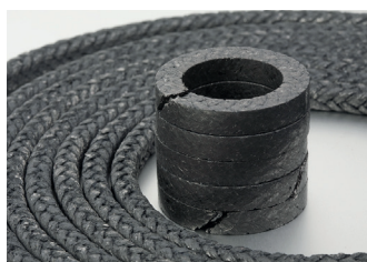
Empaquetaduras de grafito