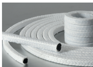
Empaquetaduras de grafito/PTFE